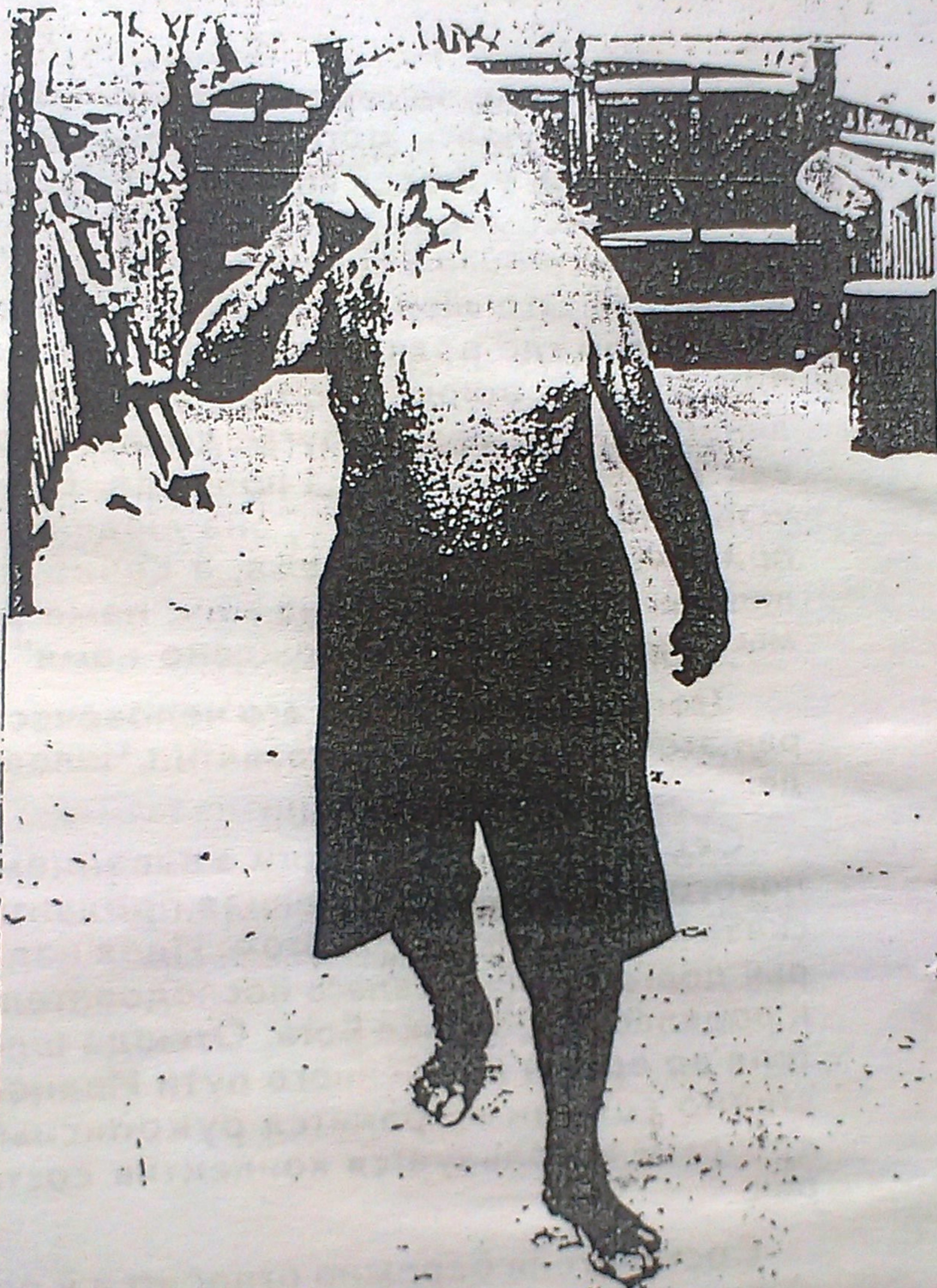
1977год. ДОМ ЗДОРОВИЯ УЧИТЕЛЬ НА ПРОГУЛКЕ.